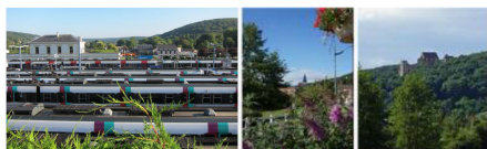
Projets RATP en gare de Saint-Rémy-lès-Chevreuse

----- Conférence de presse du 12 avril 2017 à Saint-Rémy