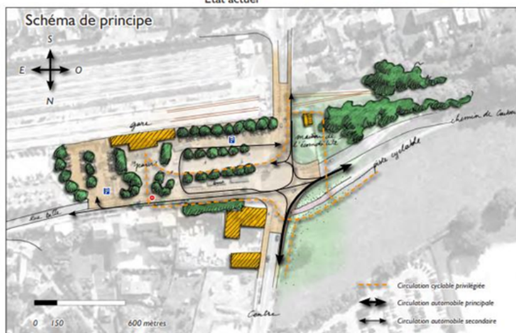
Plan Paysage et Biodiversité des Vallées de l'Yvette - PNR de la Haute Vallée de Chevreuse - 2012