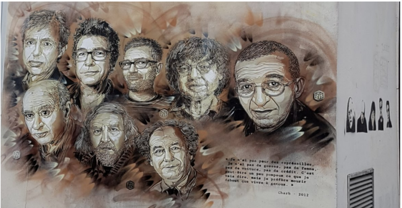
Mur décoré par l'artiste C215