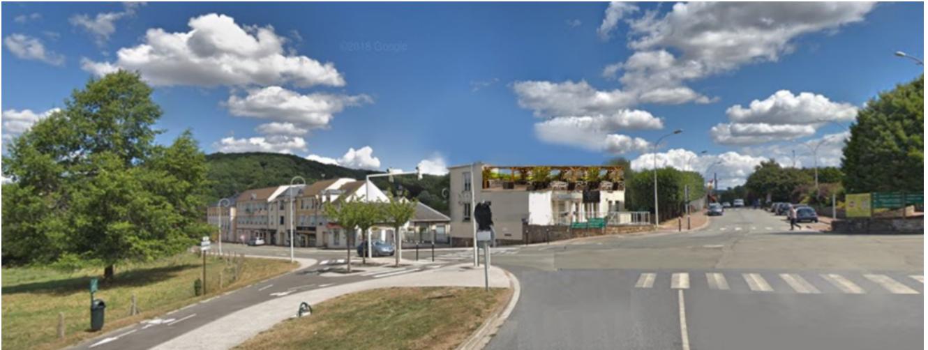
Illustration de roof-top au-dessus du bâtiment de l'ancienne mairie