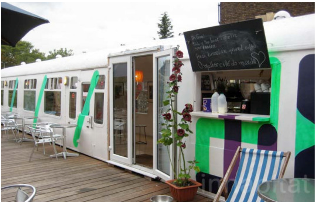
Exemple de wagon-bar sur l'ancienne voie ferrée

N'hésitez à pas à nous faire part de vos bonnes idées dans notre forum !