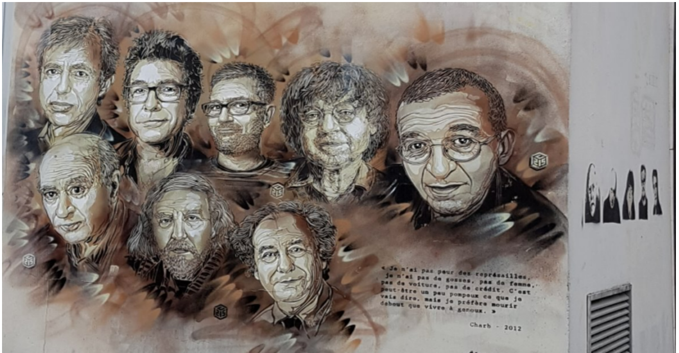
Mur décoré par l'artiste C215