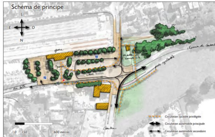
Plan Paysage et Biodiversité des Vallées de l'Yvette - PNR de la Haute Vallée de Chevreuse - 2012 27