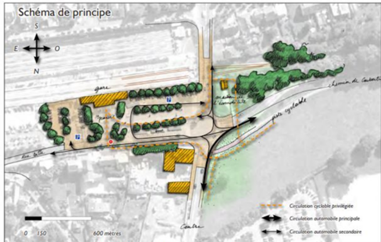
Plan Paysage et Biodiversité des Vallées de l'Yvette - PNR de la Haute Vallée de Chevreuse - 2012 27