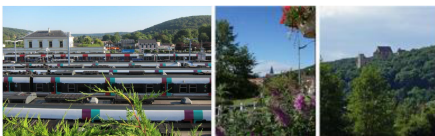
Projets RATP en gare de Saint-Rémy-lès-Chevreuse

----- Conférence de presse du 12 avril 2017 à Saint-Rémy