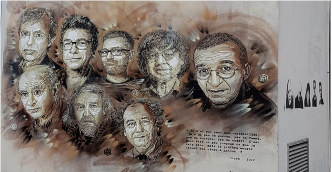
Mur décoré par l'artiste C215